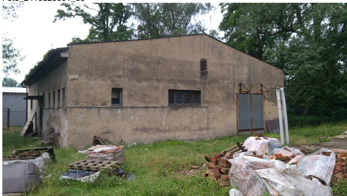
Zdroj: Finanční správa