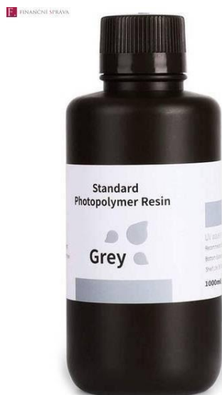
Zdroj: Ilustrační foto