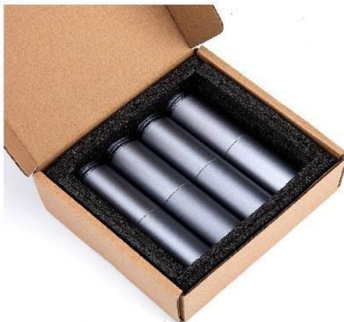
Zdroj: Ilustrační foto