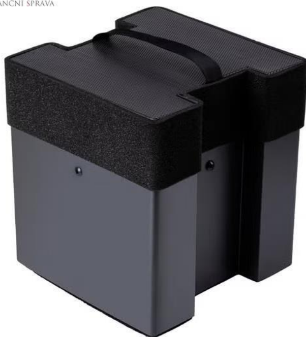
Zdroj: Ilustrační foto