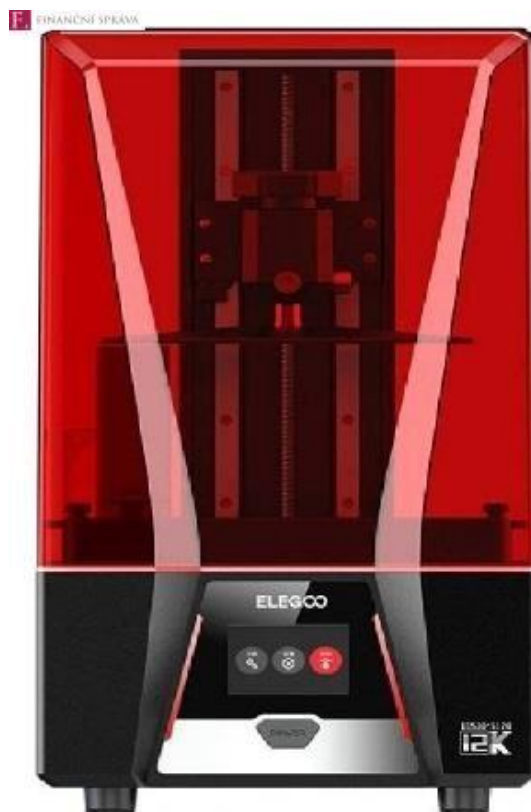
Zdroj: Ilustrační foto