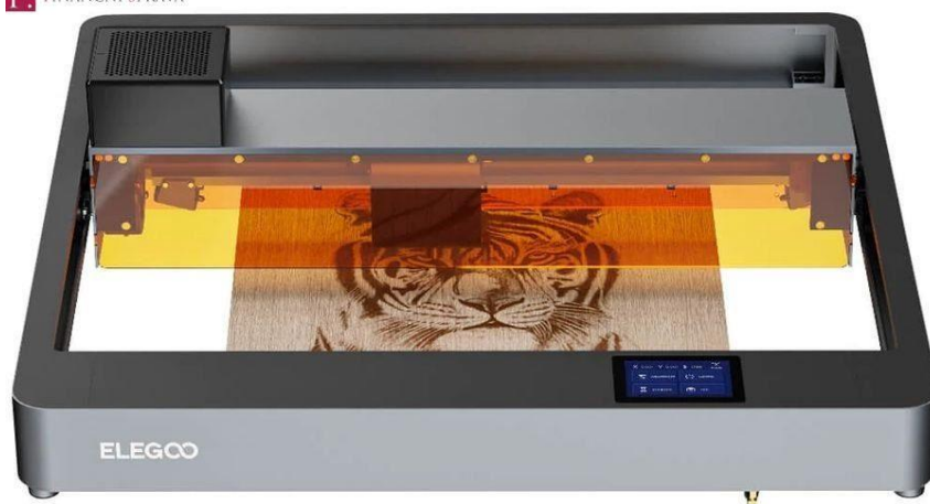
Zdroj: Ilustrační foto