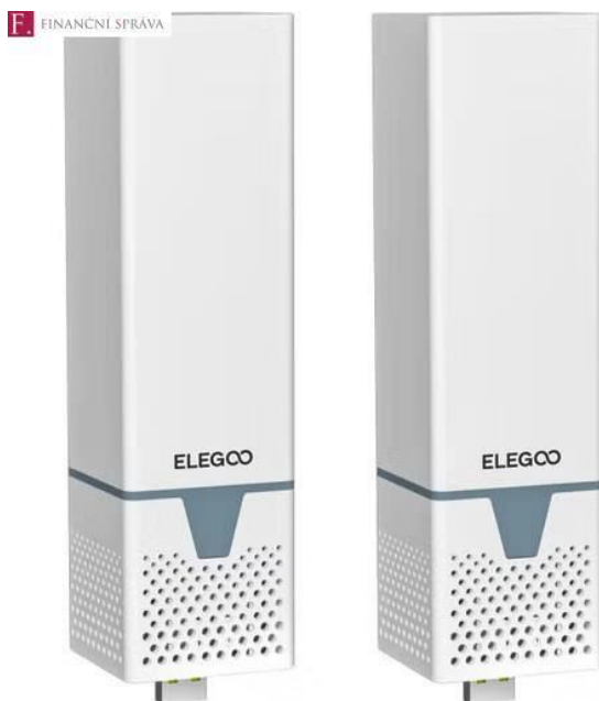
Zdroj: Ilustrační foto