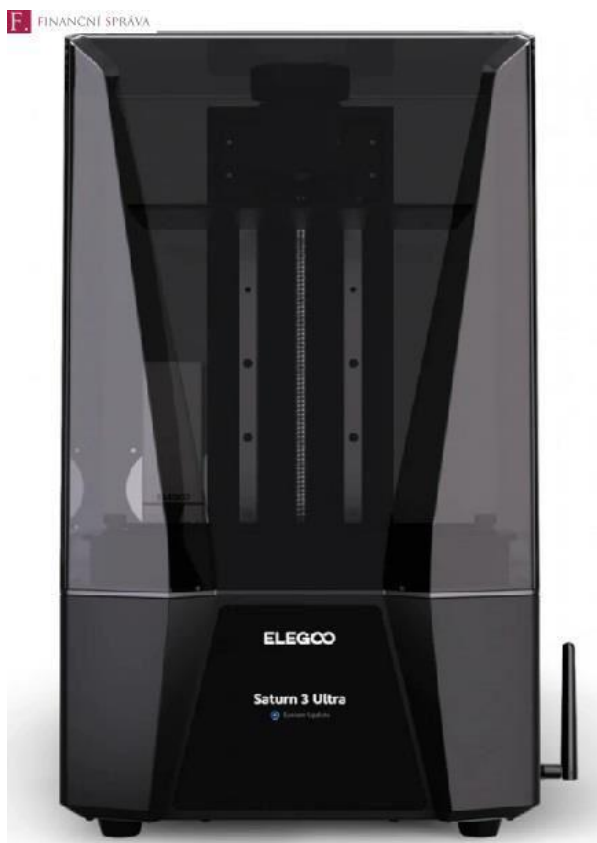
Zdroj: Ilustrační foto